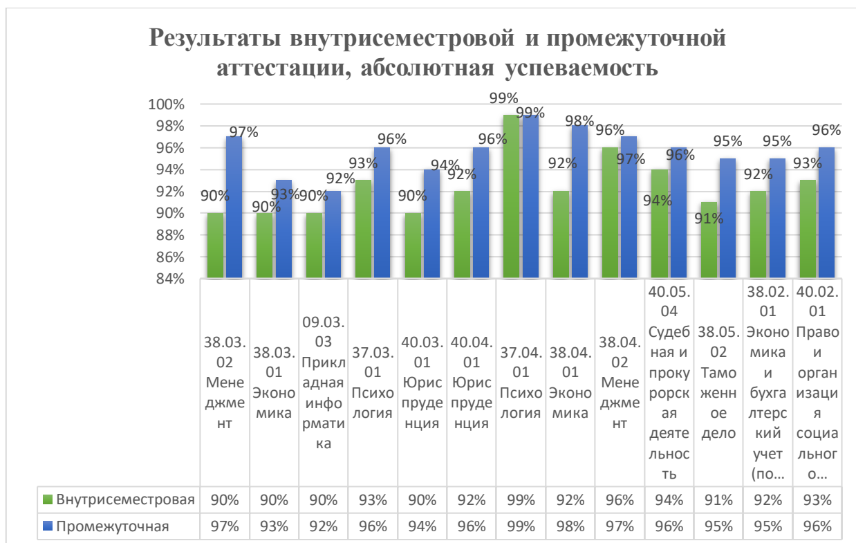
Рис 3. Результаты внутрисеместровой и промежуточной аттестации 2023-2024 учебный год, абсолютная успеваемость, %