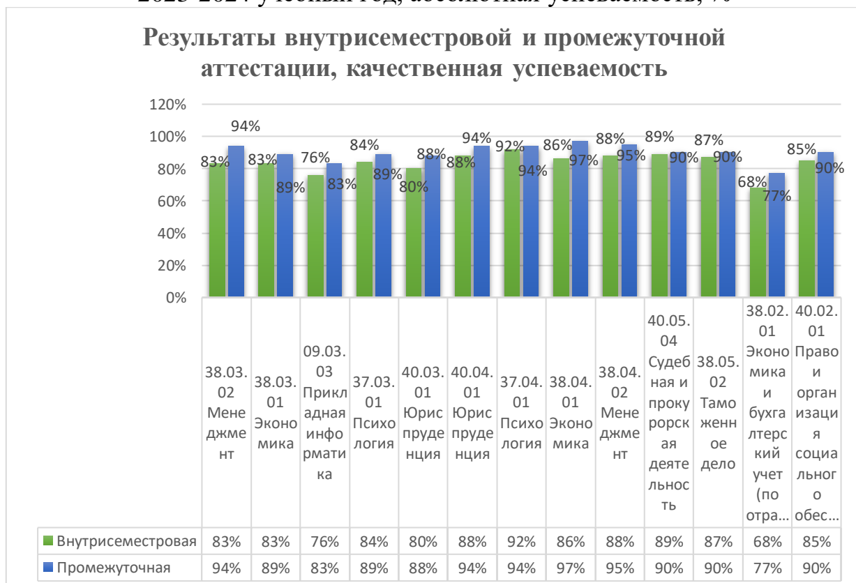
Рис 4. Результаты внутрисеместровой и промежуточной аттестации 2023-2024 учебный год, качественная успеваемость, %