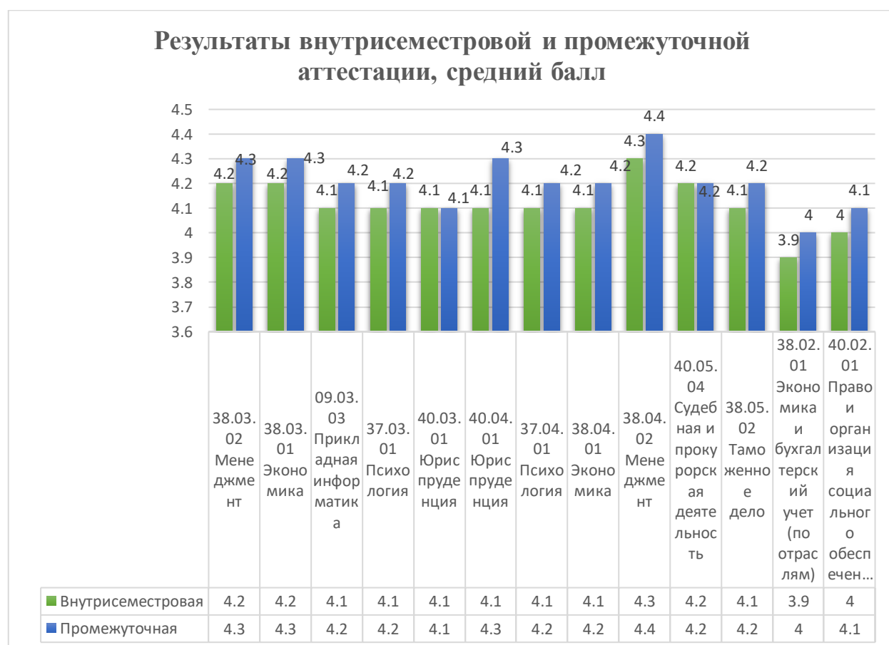
Рис 2. Результаты внутрисеместровой и промежуточной аттестации 2023-2024 учебный год, средний балл

образовательной программой, в Институте организуется промежуточная аттестация. Результаты промежуточной аттестации за 2023-2024 учебный год в сравнении с внутрисеместровой представлены на рис. 2-4. Обучающиеся показали высокий уровень освоения учебных предметов, курсов, дисциплин (модулей). Так, средний балл составляет от 4,0 до 4,4. Наименьший балл показали обучающиеся по специальности 38.02.01 Экономика и бухгалтерский учет (по отраслям). При этом абсолютная и качественная успеваемость соответственно составляют – 95% и 77%, что является хорошим показателем. Наивысший средний балл (4,4), как и один из самых высоких показателей абсолютной и качественной успеваемости (97% и 95%) у обучающихся по направлению подготовки 38.04.02 Менеджмент. Такой высокий результат можно объяснить более осознанным и серьезным отношением обучающихся к получению второго уровня высшего образования – магистратуры.